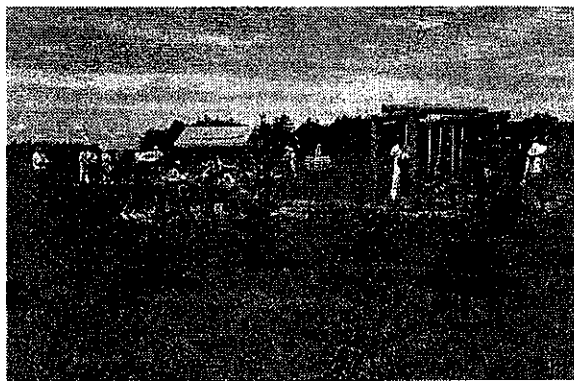
牧場のようにのんびりできる広場

柏原の北の入り口では、職員が牧野風の手作り公園をつくり、カシワの牧柵がそれらしい雰囲気を出した。管理はややラフだが肩の凝らない牧場のような広場は、郊外である苫東方面へドライブしながら小さな子供を遊ばせる場所として少しずつ広まり、工業用地には珍しく女性と子供がたたずむエリアが生まれたのである。利用者の声をもとにハーブ園やトリムコースなどを増やし、わずか3haあまりの、それも鉄塔のそばの何もない牧草地がいつの間にか年間数千人が足を運ぶところになった。保全緑地の「つた森山林」も同じ時期に開放され、探鳥会や遠足なども行われるようになっていく。