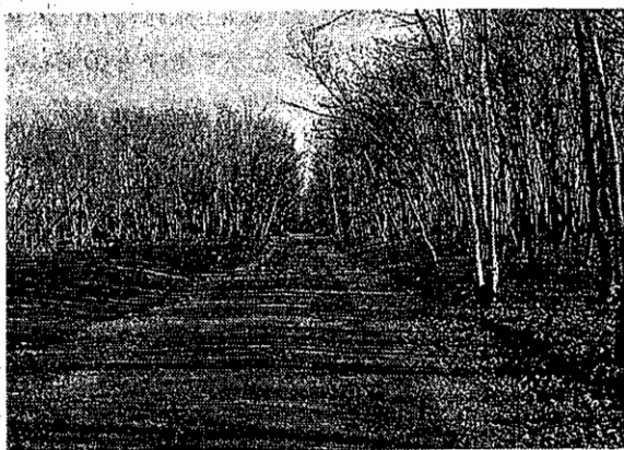
苫東版「緑のトンネル」

だが、苫東のもつ資質を生かした「緑豊かな工業基地」にこだわると、どうしても基地内に広汎に存在する天然生広葉樹林（以下「雑木林」）の魅力を引き出して育林方法と現況有姿型の造成に活路をつける必要がある。そのため折りにふれて沿道の雑木林の間伐を進めており、平成2年には通称「緑のトンネル」と呼ばれる、視察のめぬき通りの一部で間伐とまき芝をして、雑木林のキャンパスができたが、これはいわば現況有姿型のショウウィンドウにもなっている。