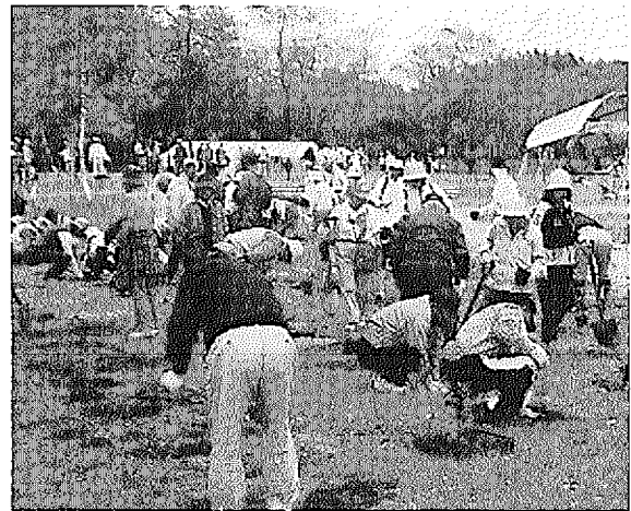
つた森山林での「里山」活動、資料：当社HP

現在は森づくり事業（里山的森林環境を増やしていくための植樹、草刈り等）、ひとづくり事業（地域に住む幼児、児童、保護者向けの体験学習、セミナー等）、業務推進事業（広報活動、ボランティアのコーディネート等）を柱として活動しています。