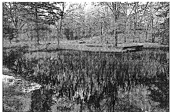
苫東地域の概況（整備の進む柏原地区と緑の豊かな「つた森山林」（右側）、資料：当社HP