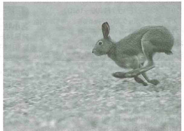
「エゾユキウサギ」(撮影地:旭川市 江丹別)

うっそうと茂る草木の中に、コンクリート製の四角い建造物が鎮座しています。煙突状の空気孔が天井から突き出す姿はこぢんまりとした住居のようにも見えますが、太平洋戦争末期米軍進攻に備えて建てられ、現存する真正正銘の「トーチカ」。現在がからんと何もない内部には、当時、最新鋭の対戦車砲が置かれていたそうです。太平洋の方向に大砲用の銃眼(窓)が開かれ、米軍上陸の危機が現実だったと実感できます。折しも戦後70年の節目。決して繰り返してはいけない過去が身近にも存在したと、忘れずにいたいものです。